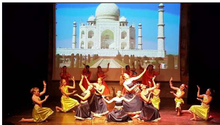
Voyage en Inde Groupes intermédiaires, ados et adultes

L'Association MOVING accueille depuis quatorze ans adultes et enfants et ce, toute l'année. Elle regroupe une cinquantaine de participants autour d'activités au choix : danses variées contemporaines et classiques, overdance et stretching.