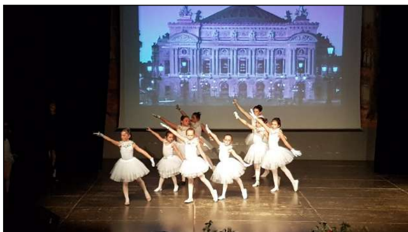
Les petits Rats de l'opéra Groupe juniors et intermédiaires

Danseuses et danseurs ont effectué tous ces tableaux avec bonheur pour le plus grand plaisir de leurs familles et amis réunis dans la salle.